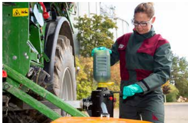
OP DE SPUITMACHINE