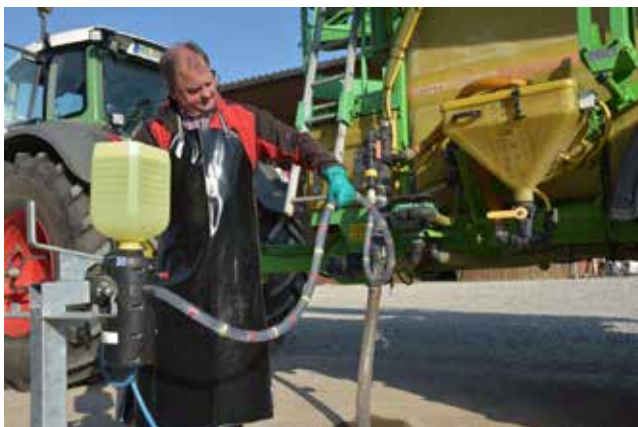
LOS VAN DE SPUITMACHINE

U kunt het trainingsmateriaal van Pentair (Cleanload Nexus installatie, gebruik en onderhoud) direct raadplegen door u te registreren op: cleanloadnexus.com/training